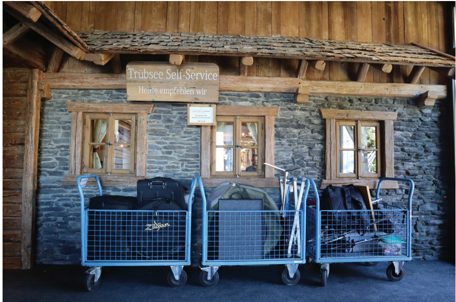
Das Schlagzeugmaterial musste für den Transport mit der Gondelbahn gut verpackt werden.