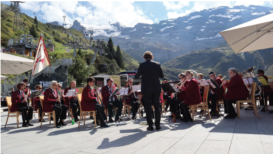
Die Stadtmusik spielt auf der Terrasse vom Restaurant Trübsee mit Ausblick auf den wolkenverhangenen Gipfel vom Titlis.