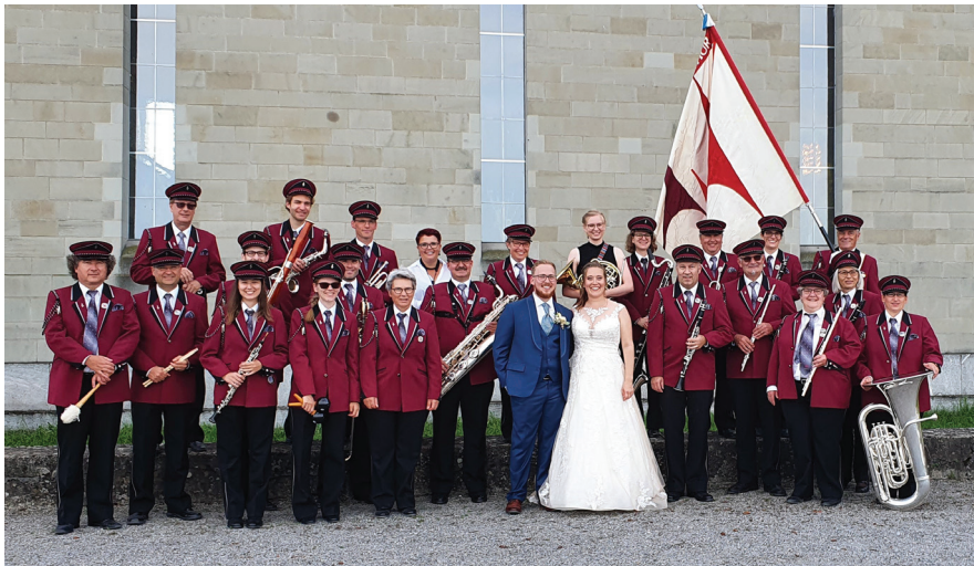
Die Stadtmusik am Hochzeitsfest in Horn am Bodensee.

Apéro musikalisch umrahmen. Wir wünschen den beiden alles Gute!