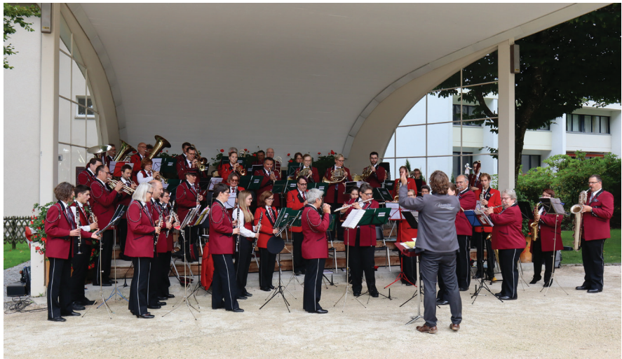
Das Gemeinschaftskonzert mit der MG Engelberg am Samstagabend war ein voller Erfolg.