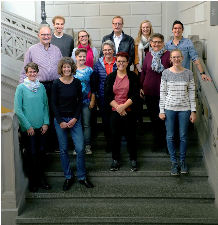
Mitwirkende beim Projekt «Jubiläumsbuch Stadtmusik Winterthur».

ne Musikformationen des Vereins vorgestellt, von Musikreisen berichtet und noch vieles mehr. Das Geschriebene wird durch Fotos sowie Bildstrecken ergänzt. Rechts ist eine Seite aus dem Geschichten-Teil abgebildet. Das Jubiläumsbuch wird offiziell am Filmkonzert vom 26. März im Theater Winterthur vorgestellt. Anschliessend können Sie dieses bei allen Konzerten der Stadtmusik im Jubiläumsjahr erwerben.