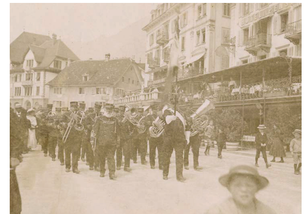
Vereinsausflug und Einmarsch in Brunnen (1911).