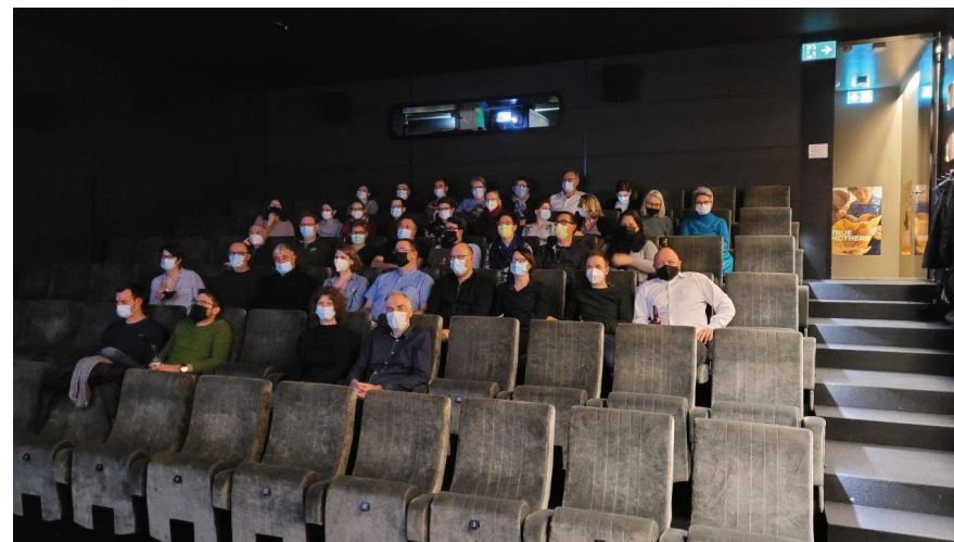
Einige Mitglieder der Stadtmusik schauen sich den «Kilometerfresser» im Kino Cameo an.

einen ganzen Kinosaal gemietet, damit wir den «Kilometerfresser» im richtigen Ambiente geniessen konnten. Mit den richtigen Bildern vor Augen macht die Probearbeit gleich doppelt so viel Spass.