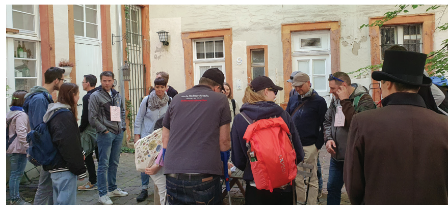
Stadtführung in Heidelberg mit Theatereinlage und Mordauflklärung.