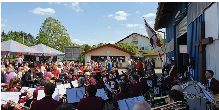
Erstes Konzert beim Anlass «Wein & Musik».

Im «Badischen Gasthaus zum Goldenen Löwen» in Eppelheim wurden mir während des gemeinsamen Nachtessens von meinen Tischnachbarn bzw. meiner Tischnachbarin die Vornamen aller Musikantinnen und Musikanten beigebracht. Da einzelne Vornamen doppelt oder sogar dreifach vertreten sind, hielt sich der Aufwand in einem durchaus zumutbaren Rahmen. Trotzdem war ich froh, dass wir es bei den Vornamen belassen haben – obschon bekanntlich von gewissen Nachnamen eine beachtliche Häufung vorkommt.