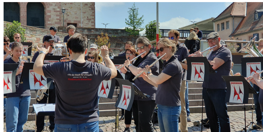
Konzert am Bensheimer Markt bei super warmen Wetter.

lichkeit sowie des begeisterten Publikums ein sehr dankbarer. Anschliessend hatten wir in Speyer verschiedene Möglichkeiten, den Nachmittag zu verbringen. Viele haben den Dom besucht oder sind im Technikmuseum in ausrangierte Flugzeuge und Schiffe gestiegen. Vom Programmpunkt «Abend zur freien Verfügung» wurde ich getäuscht: Beim Nachtessen musste ich Rede und Antwort stehen. Es ist klar, dass man nicht einfach so als «Neuer» mit auf die Musikreise gehen kann, ohne etwas von sich erzählen zu müssen. Ich bin mir nicht mehr ganz sicher, wann genau das Schnappfässchen mit den drei Bechern das erste