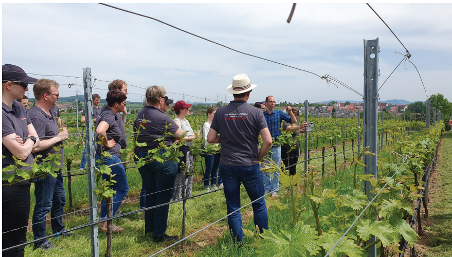
Besichtigung des Weingutes Kleinle.