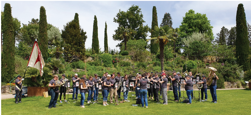
Abschlusskonzert im Schlossgarten der Ludwigsburg.