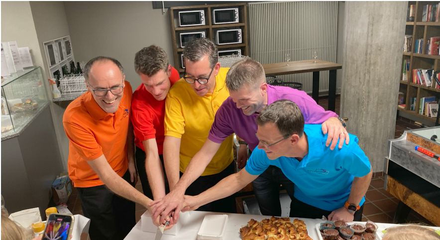
Die Tuplabrassi schneiden gemeinsam die Jubiläums-Torte an